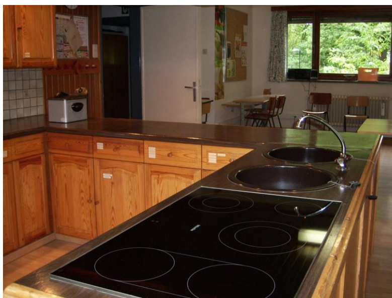
Aandacht voor praktische vaardigheden waar mogelijk.

Als leerling heb je steeds het recht een mondeling of schriftelijk advies in verband met de werking van de school over te maken aan de directeur of de inrichtende macht. Dit voorstel of advies zal steeds op het juiste niveau besproken worden en je zal een antwoord ontvangen.